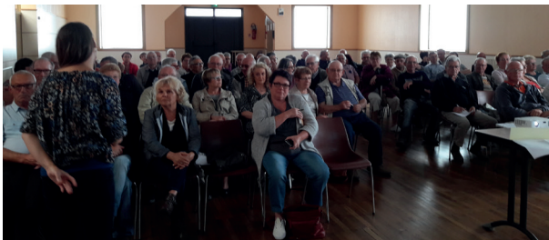
Sensibilisation aux économies d'énergie, Guiméné Penfao, 9 juin 2016.

FACE Loire Atlantique intervient afin de sensibiliser à la maîtrise d'énergie et d'apporter des solutions concrètes pour l'amélioration de l'habitat.