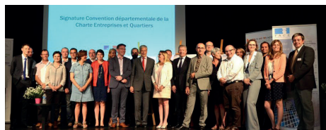
Les signataires de la Charte Entreprises et Quartiers - Salle Festive Nantes Erdre - 6 juillet