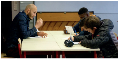
Des élèves du collège Pierre Norange attentifs au discours d'un professionnel.

→ Forum des métiers au collège Pierre Norange: 25 professionnels (23 métiers, 12 secteurs d'activité) ont rencontré 90 jeunes de 3 e .