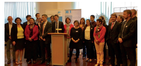
Lancement Junior Academy - La Poste - 28 septembre.

12 jeunes diplômés de bac +2 à bac +5 habitant pour la plupart les quartiers prioritaires de l'agglomération nantaise ont rejoint cette promotion lancée dans les locaux de la Poste de Nantes. Cette rencontre a eu lieu en présence de Madame Hélène Geoffroy, Secrétaire d'État chargée de la Politique de la Ville et du Sous-Préfet Sébastien Bécoulet.