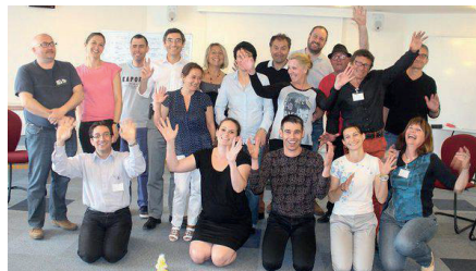
Atelier collectif Job H' Academy - Saint Nazaire.

FACE Loire Atlantique a lancé la 1 re Job Academy pour aider des chercheurs d'emploi reconnus handicapés et habitant un quartier prioritaire de l'agglomération nazairienne. Ils sont 11 candidats et 19 entreprises se sont engagées à leurs côtés.