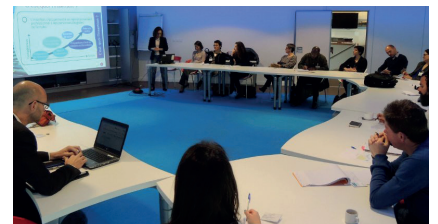
Diversifier les modes de recrutement - 21 avril 2016.

La joie au travail - 8 février L'accès à la formation - 23 février Égalité professionnelle femmes/hommes - 8 mars Détection et discrimination - 14 avril Diversifier les modes de recrutement - 21 avril Présentation du label Lucie - 19 mai Changer de regard sur la précarité par le théâtre - 29 juin L'humour en entreprise et la performance - 22 novembre Favoriser la mixité des métiers - 25 novembre Sensibilisation contre l'homophobie et la transphobie - 15 décembre