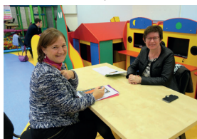
Simulation d'entretien - Place à l'Emploi - 3 novembre