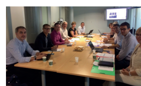
Le Conseil d'administration de FACE Loire Atlantique.

Mais face à cela, nous sommes tous capables d'être acteurs, de poser de petits actes concrets, comme le colibri dans la légende.