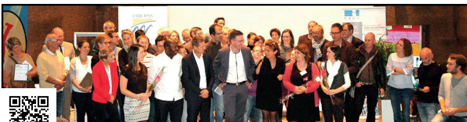
Les participants et les organisateurs du prix La Part des autres lors de la soirée festive de remise des récompenses, le 11 octobre 2016.

Ce prix qui s'inscrivait dans les perspectives de l'année 2016 a vu le jour et s'est déroulé le 11 octobre dans les locaux de l'AFPA. Co-construit pendant un an avec l'URIOPSS, union régionale d'associations, le projet a permis de récompenser devant une assemblée de 140 personnes 4 binômes association/entreprise ayant mené ensemble une action de solidarité dans la durée. Une prochaine édition aura lieu en 2018. Les photos, les noms des lauréats et l'ensemble des projets présentés sont à retrouver sur www.lapartdesautres.fr .